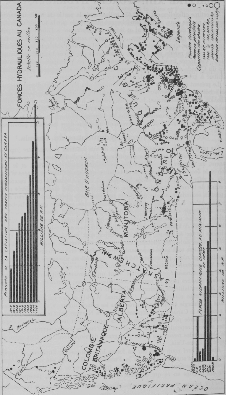
FORCES HYDRAULIQUES CAPTÉES, AU MINIMUM DE DÉBIT